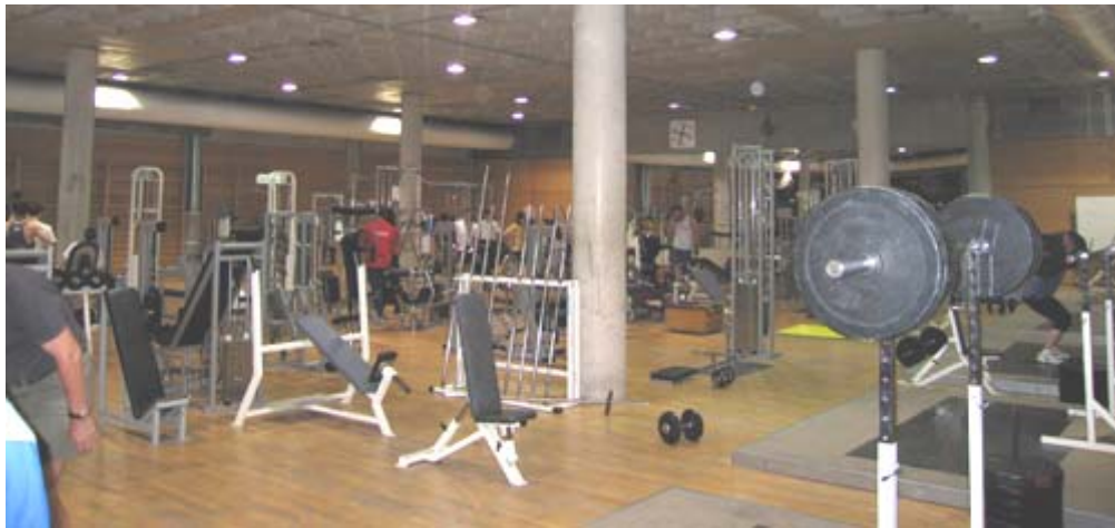
SALA DE MUSCULACION CAR DE MADRID

6. DURACION: El disfrute de la Beca será desde septiembre de 2007 hasta el 31 de julio de 2008