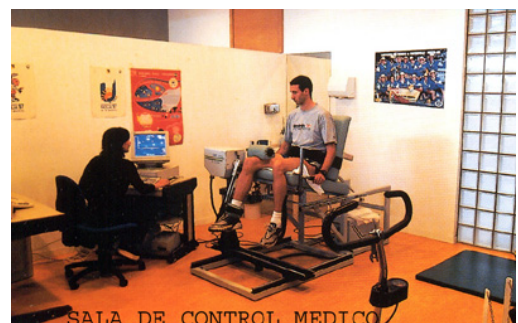
SALA DE CONTROL MEDICO