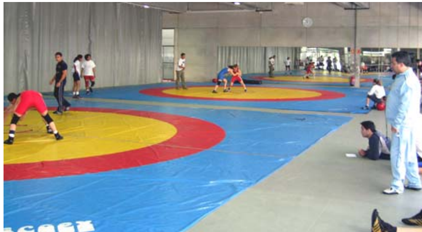
SALA DE COMBATE CAR DE MADRID

Todos los medios materiales y humanos para sacar el máximo partido de las facultades de cada deportista.