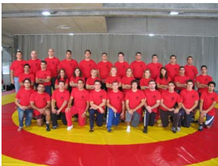
EQUIPO CAR 2005/2006

La concesión de becas para la residencia Joaquín Blume tiene por objeto facilitar el entrenamiento de los deportistas de máximo nivel dando la posibilidad de tener su lugar de residencia y estudios en el propio Centro de Alto rendimiento de Madrid.