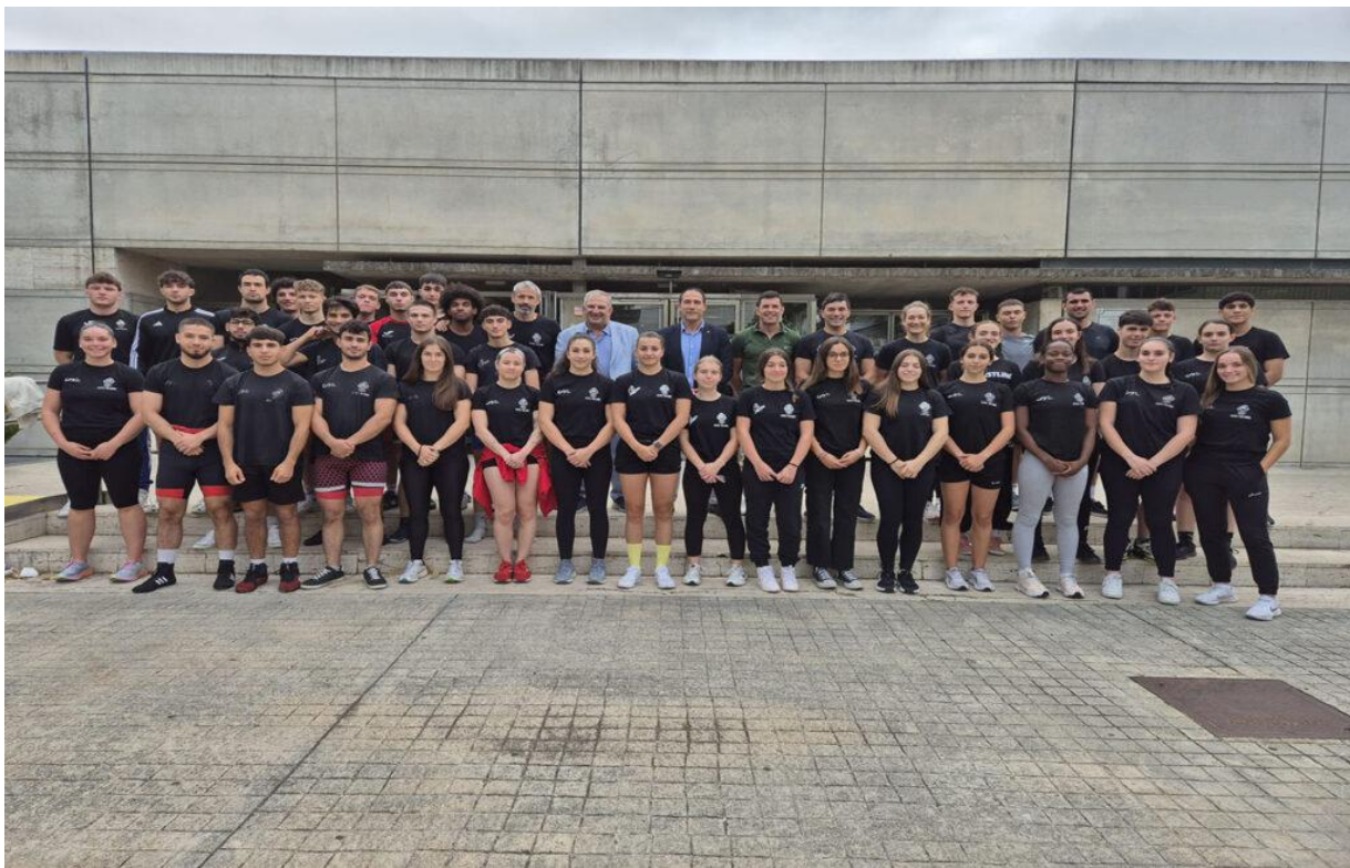
EQUIPO CAR 2024/2025

La concesión de becas para la residencia Joaquín Blume tiene por objeto facilitar el entrenamiento de los deportistas de máximo nivel dando la posibilidad de tener su lugar de residencia y estudios en el propio Centro de Alto rendimiento de Madrid.