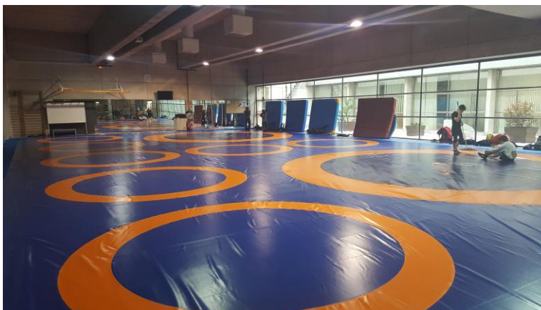
SALA DE COMBATE CAR DE MADRID

Todos los medios materiales y humanos para sacar el máximo partido de las facultades de cada deportista.