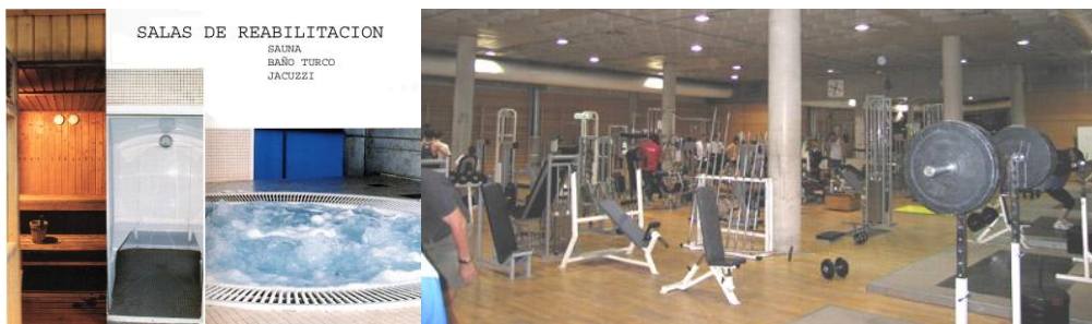
SALA DE MUSCULACIÓN CAR DE MADRID